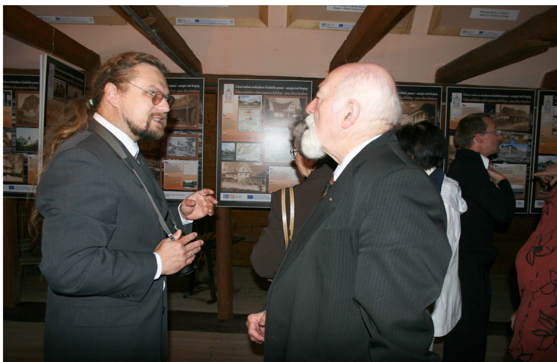
Vernisáž výstav ve skanzenu Muzea Kultury Ludowej Pogórza Sudeckiego w Kudowie Zdroju

Slibně se také rozvíjí i mezinárodní spolupráce. V rámci celé Evropy udržujeme kontakty s muzei majícími ve správě opevnění z 30. let 20. století. S polskými kolegy si vyměňujeme zkušenosti vždy v září na společném setkání českých a polských muzeí v rámci Dnů česko-polské křesťanské kultury, které se v roce 2011 konalo v polské Kamienné Góře. Vyvrcholením této spolupráce byl společný grant s Muzeem lidové kultury Stroužné Lidová roubená architektura na kladském pomezí – mizející tvář krajiny.